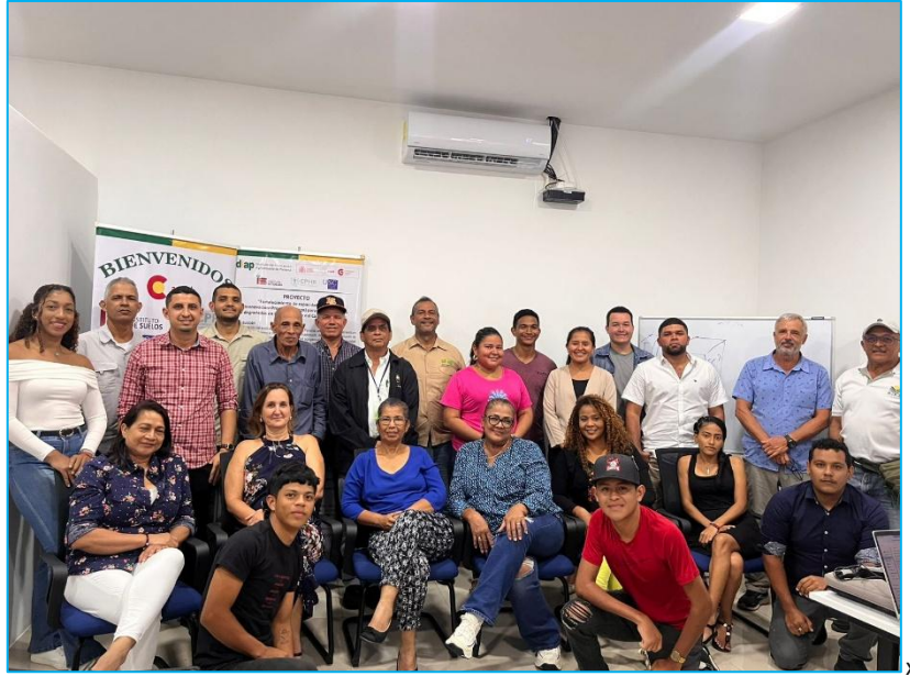
Participantes de la Mesa Redonda en el Centro de Centro de Gestión Socioambiental de la Cuenca Hidrográfica del Canal de Panamá, con el tema: Degradación de los suelos y soluciones para su restauración en la región Oeste del Canal de Panamá.