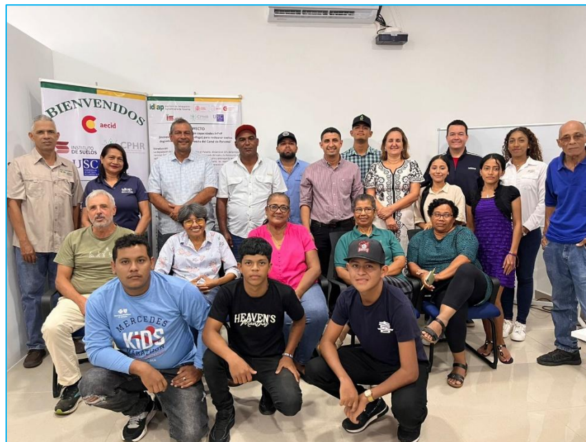
Participantes de la jornada de Capacitación en el Centro de Centro de Gestión Socioambiental de la Cuenca Hidrográfica del Canal de Panamá. IDIAP, IS, USC, Universidad de Panamá, Comité de Cuencas, Redes de Jóvenes, ANAGAN, Productores de Café y Productores de Piña de Panamá Oeste.