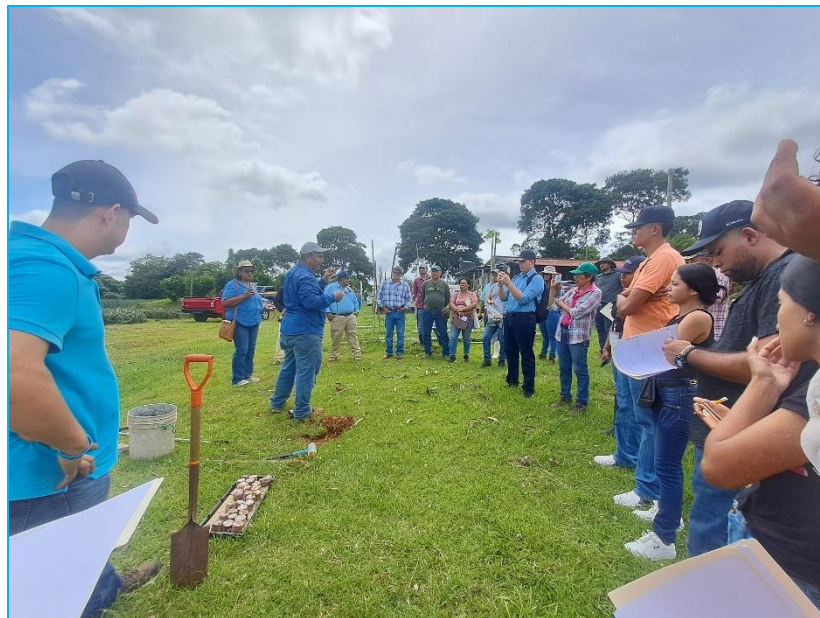
Demostración de métodos sobre el análisis y diagnóstico de propiedades físicas y químicas del suelo, para evaluar rápidamente la salud y características del suelo y así apoyar la toma de decisiones en manejo agrícola y conservación.