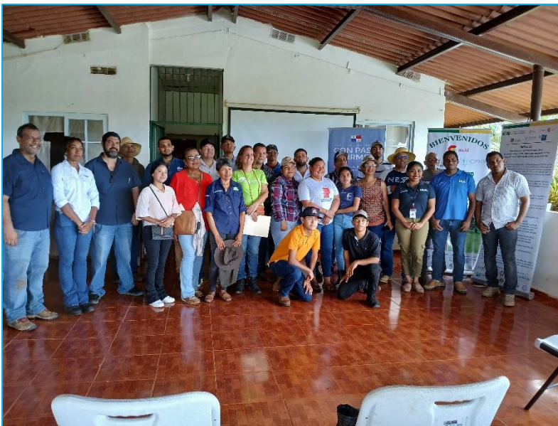
Clausura del evento y entrega de certificados a expositores y participantes del “Encuentro Internacional para la formación en prácticas de manejo de suelo que promuevan la captura de carbono y la biodiversidad”.