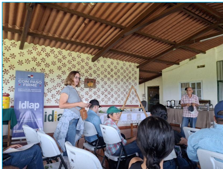
Discusión entre los expertos del Instituto de Suelos de Cuba y los participantes del evento sobre las estrategias de conservación y manejo sostenible de suelos en ecosistemas forestales y plantaciones.