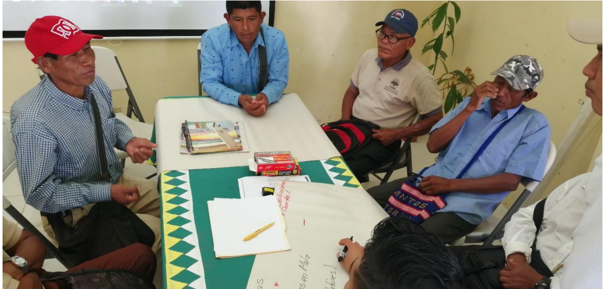
Foto 7.: Productores de ganaderos priorizando los temas expuestos.

los temas de interés por medio de un consenso entre los participantes de la mesa de trabajo y esto se estableció mediante una votación.