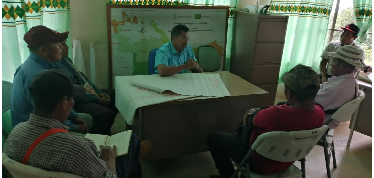
Foto 5.: Productores en las mesas de diálogos exponiendo sus problemáticas existentes en sus sistemas de producción.