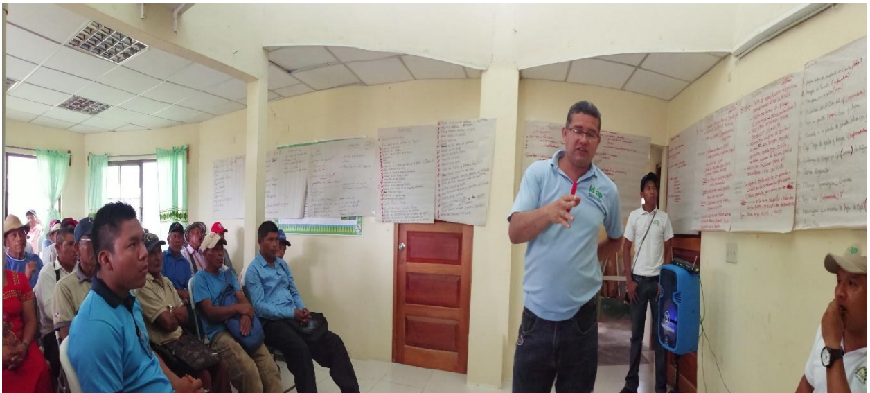
Foto 6.: Clasificación de las distintas problemáticas en colaboración Productor- Técnico.